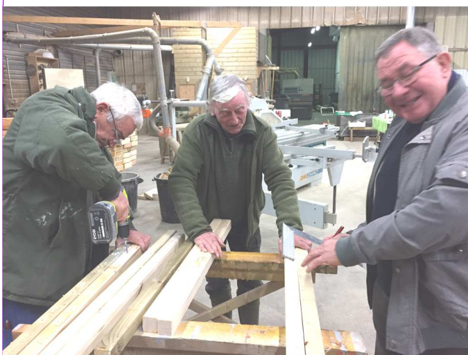
Equipe de menuisiers au travail dans l'atelier de menuiserie « l'Hirondelle » à Vallères.

7 tables restaient à réaliser ! Une équipe composée d'anciens et d'actuels menuisiers mobilisa son savoir-faire afin de répondre favorablement à la réalisation de ce projet.