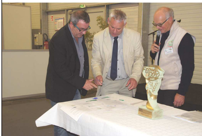
Signature de la charte zéro phyto entre le Maire et la Chambre d'Agriculture, photo prise au salon « Ferme Expo » de Tours.

Pour nous aider dans cette démarche, la Chambre d'Agriculture a proposé son aide au travers de la signature d'une convention prévoyant notamment un plan de désherbage communal et une formation dispensée aux agents techniques.