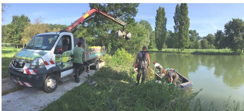
Arrachage de la Jussie sur l'Indre en 2016

Comme chaque année, le SAVI poursuit son programme d'arrachage de jussie . Les grandes stations ont été arrachées par l'entreprise FOUGERE et le reste du linéaire a été prospecté et entretenu en interne par les services du SAVI. Les derniers chiffres montrent que le travail mené depuis 2013 sur l'ensemble du cours de l'Indre permet de limiter la colonisation de l'espèce et de l'éradiquer sur plusieurs secteurs. La plante est présente sur la commune de Vallères uniquement sur des étangs privés.