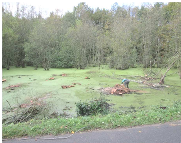
Avant travaux : Le Vieux Cher colonisé par une dense végétation ; après travaux : Le cours principal est dégagé

Comme chaque année, le SAVI poursuit son programme d'arrachage de jussie . Les grandes stations ont été arrachées par l'entreprise FOUGERE et le reste du linéaire a été prospecté et entretenu en interne par les services du SAVI. Les derniers chiffres montrent que le travail mené depuis 2013 sur l'ensemble du cours de l'Indre permet de limiter la colonisation de l'espèce et de l'éradiquer sur plusieurs secteurs. La plante est présente sur la commune de Vallères uniquement sur des étangs privés.